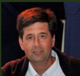
Director: Gonzalo Milic Barros