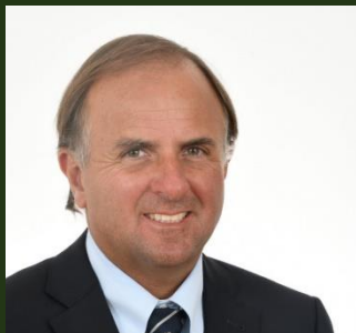
Director: Gonzalo Grebe Noguera