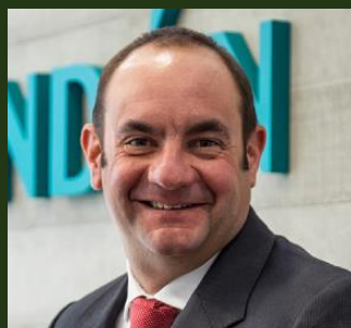
Director: Rodrigo Ruiz –Tagle Aguiló